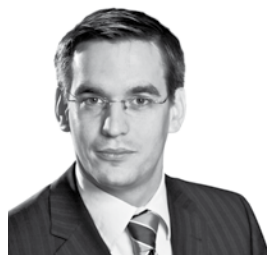
Buchhandlung am Markt

„Ich kann das Vorteilsprogramm seitenreich wirklich allen Mitgliedern nur empfehlen. Wir konnten unsere Kosten im Bereich Geldverkehr durch die Zusammenarbeit mit BCB signifikant senken, da die Gesamtkosten durch die Postenbündelung deutlich geringer sind als bei unserem bisherigen Partner. Das System läuft rund, der Support stimmt und der Umsatz ist schnell auf unserem Konto. Und auch die anderen Angebote, wie zum Beispiel für Strom/Gas oder im Versandbereich, überzeugen mit wirklich guten und exklusiven Konditionen, die nicht nur Geld, sondern auch Zeit sparen.“