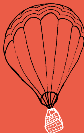
ILLUSTRATION DIANA WIDIJASAPUTRA