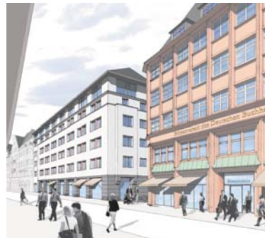
Haus des Buches

Unterkunft: Holiday Inn Express Elbestraße 7 60329 Frankfurt am Main Kontingentschluss: 9.2.12